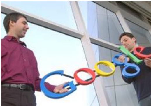
Sergey Brin y Larry Page, fundadores de Google.

Google también inició su portentosa aventura en esta región en 1998 en Menlo Park, en el garaje de una novia de Sergey Brin , nacido en Rusia y creador, con Larry Page , del hoy famoso buscador. Durante varios meses del 2005, en otro garaje de la misma localidad californiana, junto al campus de Stanford, otros dos veinteañeros, Chad Hurley y el inmigrante taiwanés Steve Chen , concibieron YouTube , que en un año y medio había escalado hasta la décima posición del ranking de audiencia en Internet. A fines del 2006 Google compró YouTube por 1.650 millones de dólares (1.290 millones de euros).