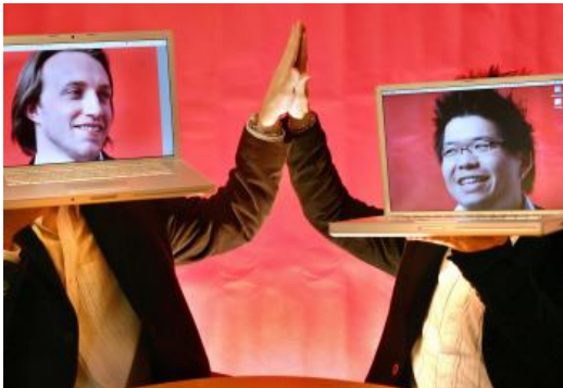
Chad Hurley (izquierda) y Steven Chen, fundadores de YouTube, posan con sus portátiles en su oficina de San Mateo, California

Los nuevos héroes de la mitología californiana de los garajes son los fundadores de YouTube, Chad Hurley y Steven Chen , abajo en la imagen.